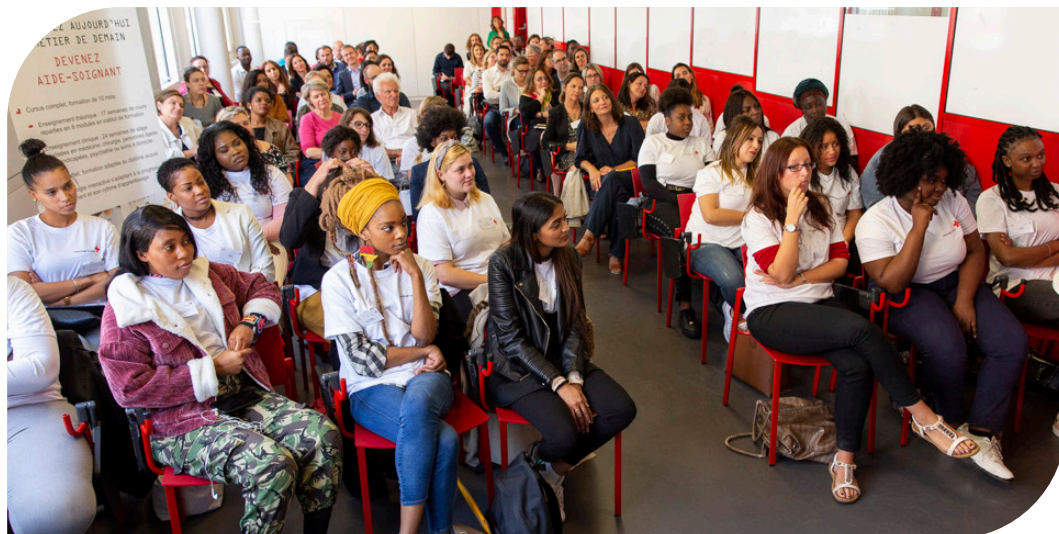
Classe Korian d'apprentis aides-soignants

Depuis le 4 janvier 2021, le Centre de Formation des Apprentis (CFA) des métiers du soin , porté par la KORIAN ACADEMY accueille ses 19 premiers apprentis aides-soignants en région parisienne au sein de l'Institut de Formation des Aides-Soignants (IFAS) d'ASSISTEAL Paris. L'objectif est d'accueillir 180 apprentis supplémentaires à la prochaine rentrée, en septembre 2021. La création de ce CFA complète la politique très active de Korian en matière d'apprentissage déjà engagée depuis 2018. et portera le nombre d'apprentis Aide-Soignants Diplômés d'État à 500 en 2021.