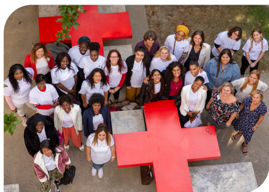
Les apprentis de la classe Korian formés avec la Croix-Rouge (2019)

En 2019, Korian et la Croix-Rouge ont noué un partenariat pour favoriser la formation et le recrutement d'aides-soignants et d'infirmiers dans les métiers du Grand Âge.