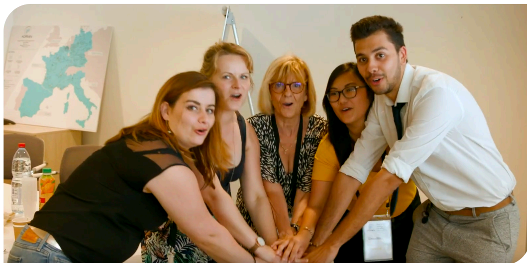
Des apprentis directeurs d'établissement lors d'une journée de travail collaboratif.

Pour voir les séances d'intégration des apprentis directeurs, cliquer ici