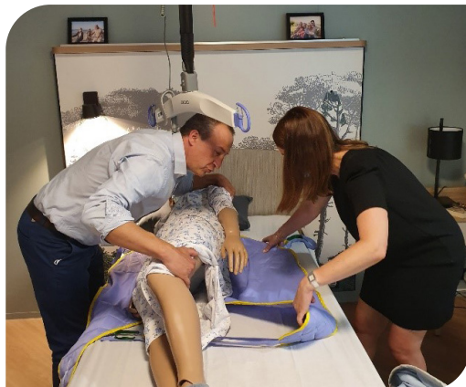
Apprentissage des bons gestes dans la chambre de simulation.