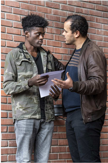
Tribunal de Bobigny